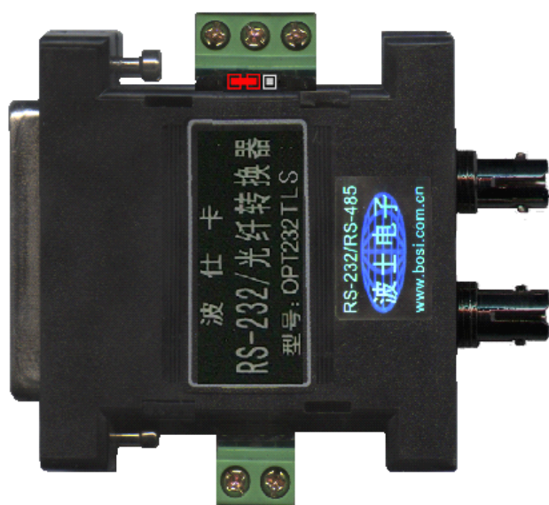
接 RS-232 时 (注意上侧面跳线靠 RS-232 口侧短接)