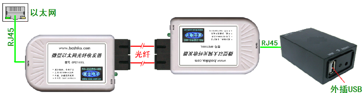
图 1： OPET-USB 全套产品