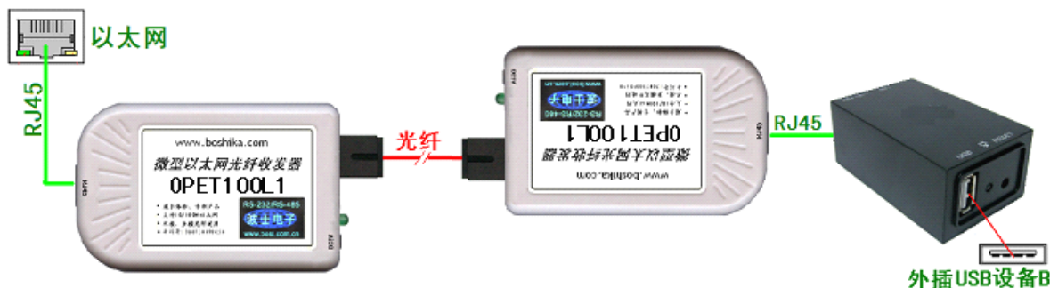
图 3： 使用 OPET100L1 的单纤 OPET-USB1 全套产品

将 2 个 OPET100L 改为一对 OPET100L1 可以实现用一根光纤延长 USB 的功能。